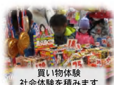
買い物体験 社会体験を積みます