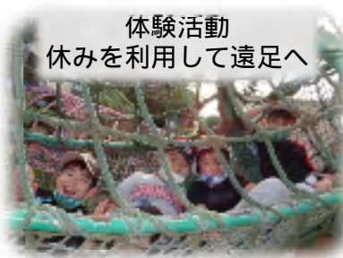
体験活動 休みを利用して遠足へ