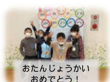
おたんじょうかい おめでとう！