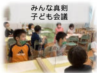
みんな真剣 子ども会議