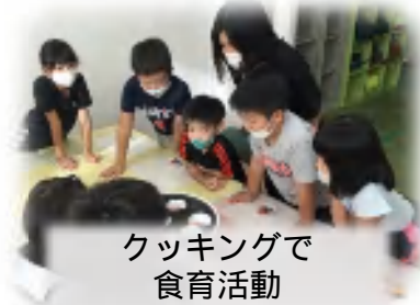
クッキングで 食育活動