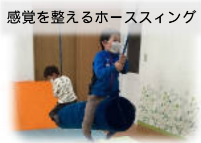
感覚を整えるホーススィング