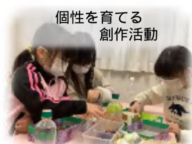
個性を育てる 創作活動