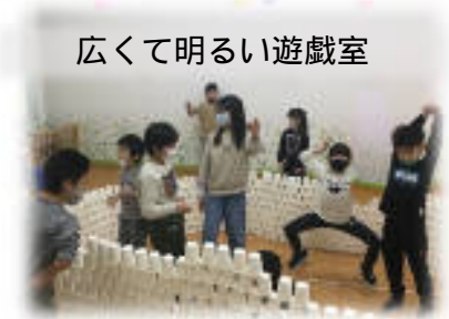
広くて明るい遊戯室