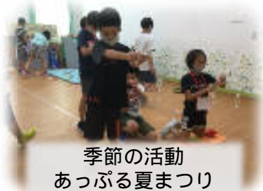
季節の活動 あっぷる夏まつり