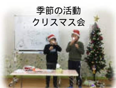
季節の活動 クリスマス会