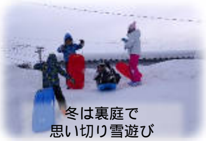
冬は裏庭で 思い切り雪遊び