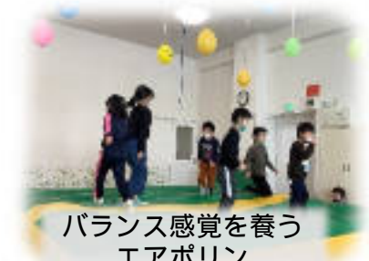
バランス感覚を養う エアポリン